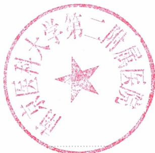
南京医科大学第二附属医院